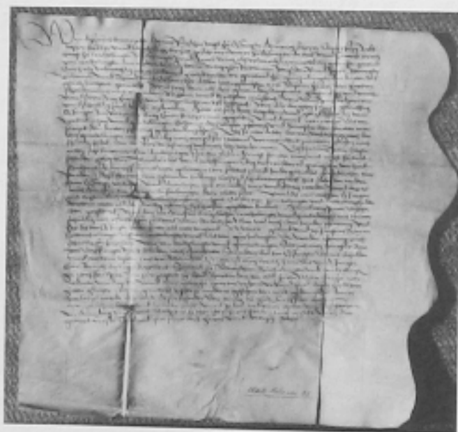
Abb. 3: „Zettel“ 1542. Gütlicher Schiedsspruch im Streit zwischen Gemeinden im Zürcher Weinland betr. Kostenverteilung beim Stellen gemeinsamer Kriegersleute.